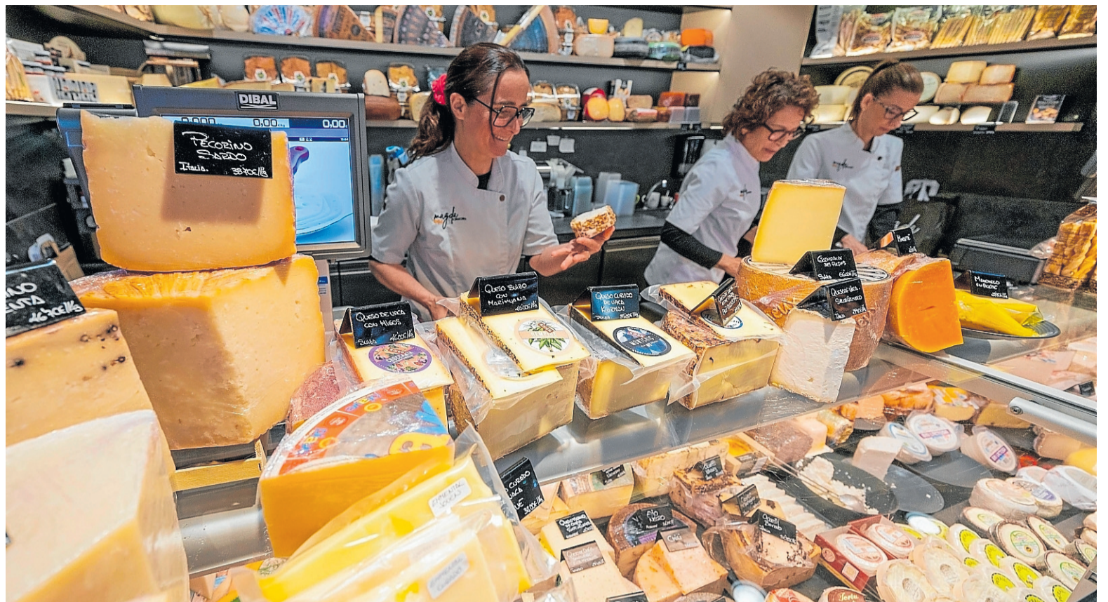
Formatgeria Magda, desde un queso bañado en whisky a otro con sabor a pesto... y todos los que caen en medio.